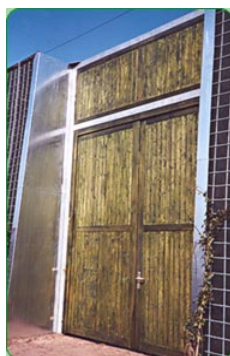
Puerta de mantenimiento y de emergencia